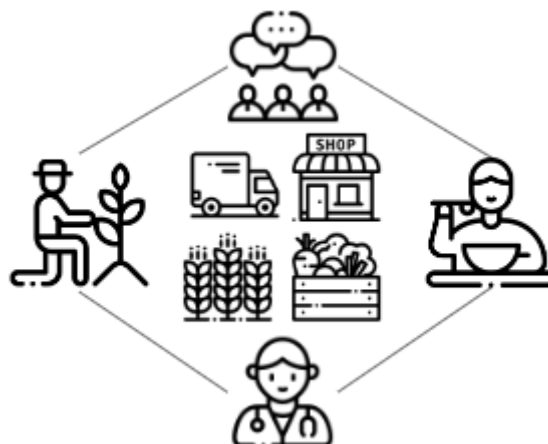
Plaatje: gezondmakende lokale keten - de mens regeert.

Een maaltijdtas is een slim en eenvoudig middel om het voor veel mensen makkelijker te maken om de gezonde keuze te maken. Zonder dat je elk etiket hoeft te bestuderen en een halve voedingsdeskundige moet zijn. Of afgeleid wordt door de ongezonde aanbieding in de supermarkt.